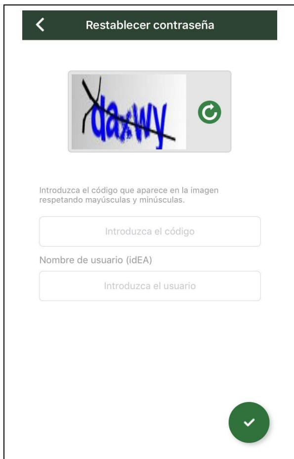
Captura de pantalla 2: “Restablecer contraseña”.

Existe un código de seguridad (denominado CAPTCHA), el cual tendrá que introducir en el apartado correspondiente, en función de la imagen distorsionada que aparece en la parte superior de esta pantalla. Es un sistema de seguridad que permite distinguir a un humano de un ordenador.