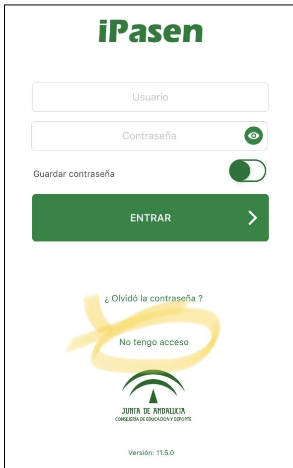
Captura de pantalla 3: si no recuerda o no dispone de su nombre de usuario, seleccione: “No tengo acceso”.

Para recuperar la contraseña, debe conocer su nombre de usuario (IdEA). Si no conoce su nombre de usuario, seleccione en la pantalla principal “No tengo acceso”.